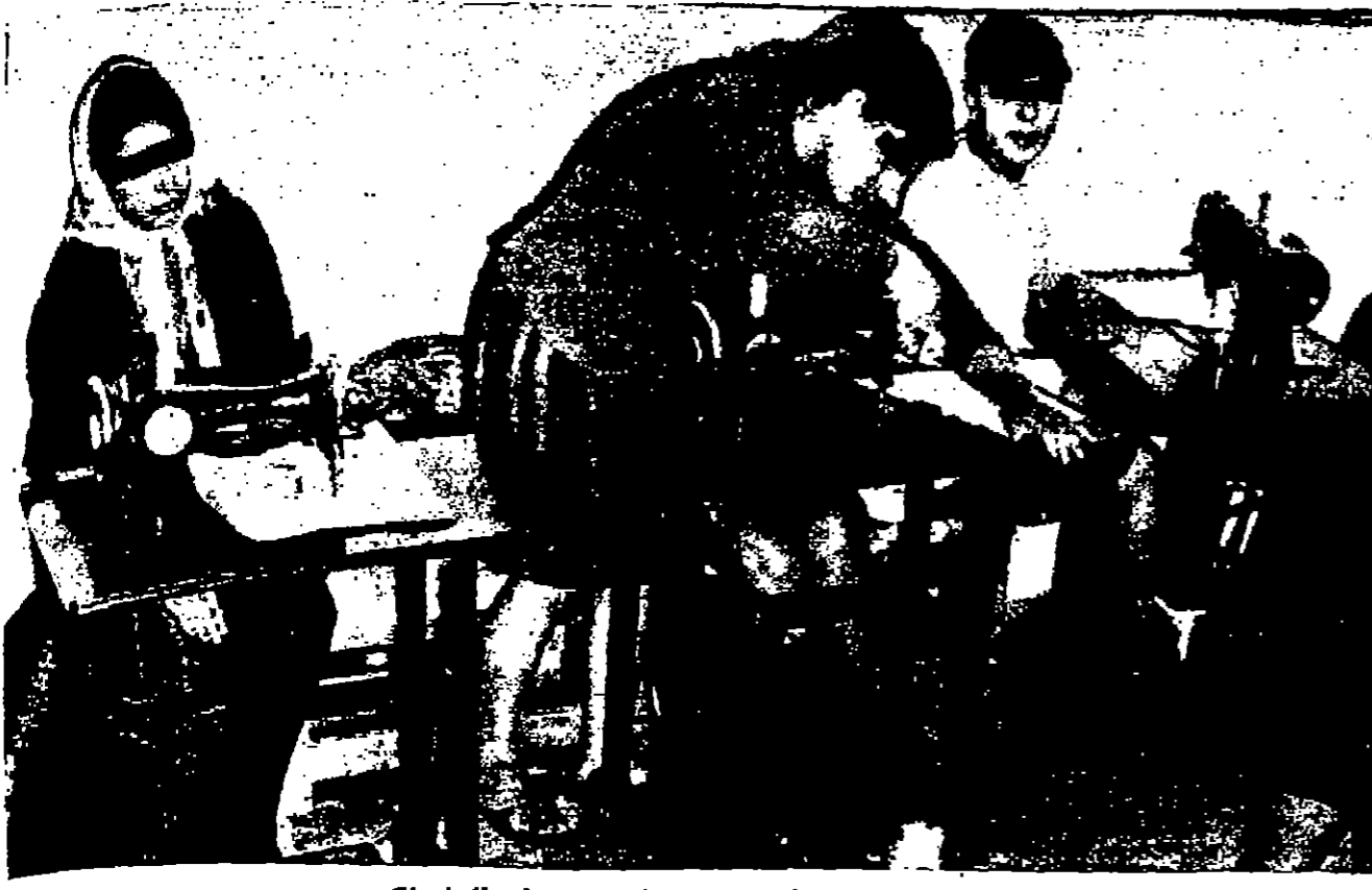
من هنا تخرج السجناء بين شرفة تقسم ابن العيسى الكرم